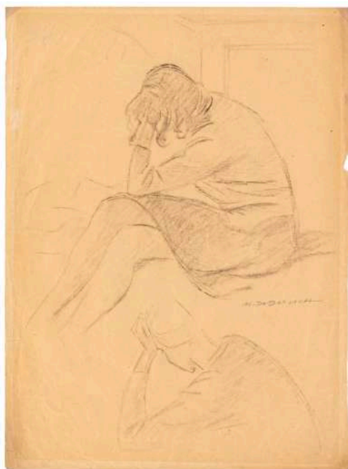
Marcello Dudovich, "Senza titolo (Studio di figura)". Matita su carta, 49,5 x 37 cm. Firmata al centro a destra l'ombra dello studio di Marcello Dudovich al retro. STIMA, euro 600 - euro 900

Enzo Mari spicca in catalogo con l'opera Progetto 1118 del 1973 (cartoni sovrapposti e fustellati, stima: €1.500 - 2.500) che nobilita il materiale cartaceo trasformandolo in colto e innovativo, facendo di Mari un precorritore di quel processo di elevazione della carta da supporto povero a materia apprezzata per la sua sostenibilità e leggerezza.