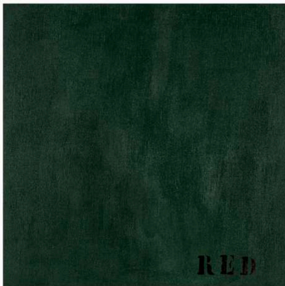
Radovan Damjanović; Damjan, Disinformazione - Red", 2020. Acrilico su tela, 50 x 50 cm. Firma, titolo e data al retro. Stima euro 2.000 - euro 4.000

Tra i più significativi interpreti dell'arte italiana del Secondo Dopoguerra, anche Enrico Castellani è tra i protagonisti della vendita. Senza titolo (stima: €3.000 - 6.000) è un acciaio estroflesso esemplificativo della sua ricerca strettamente connessa con lo spazialismo e i principi teorici della rivista Azimuth - fondata nel 1959 assieme a Piero Manzoni - volti a un completo azzeramento e rinascita della pratica artistica in un'ottica di astrazione totale.