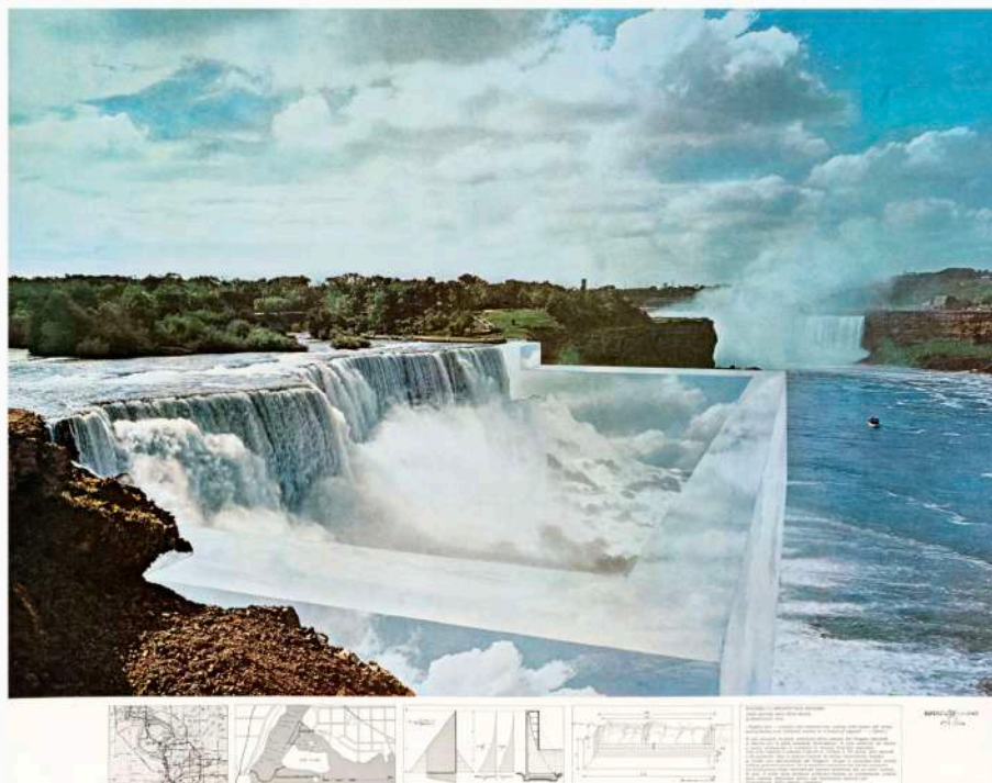
Superstudio, Niagara o l'architettura riflessa, 1970, Stampa fotografica offset su carta patinata, Edizioni Plura, Milano (timbro a secco) 68,5 x 86,5 cm, Stima euro 700 - 1.000

Art-Rite guarda al collezionismo giovane e presenta l'asta U-3 Under 3k Euros . Un'importante selezione di opere con valori di partenza inferiori ai 3.000 euro. Appuntamento il 21 luglio 2022. Si può partecipare online, al telefono e tramite offerta scritta. Qui il link al sito .