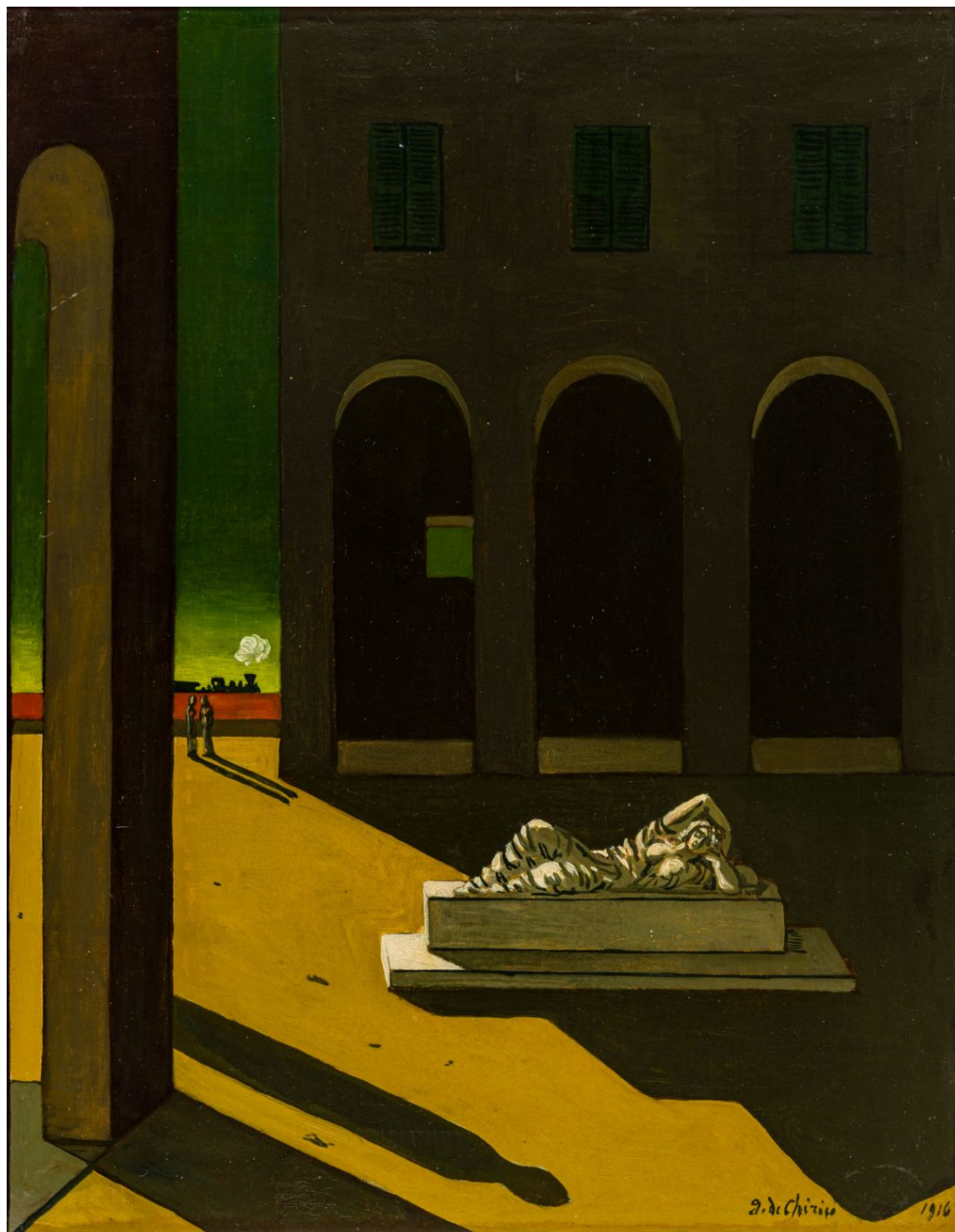
Giorgio De Chirico, Piazza d'Italia con Arianna, metà anni '40. Olio su tela, 62,7 x 49,8 cm.