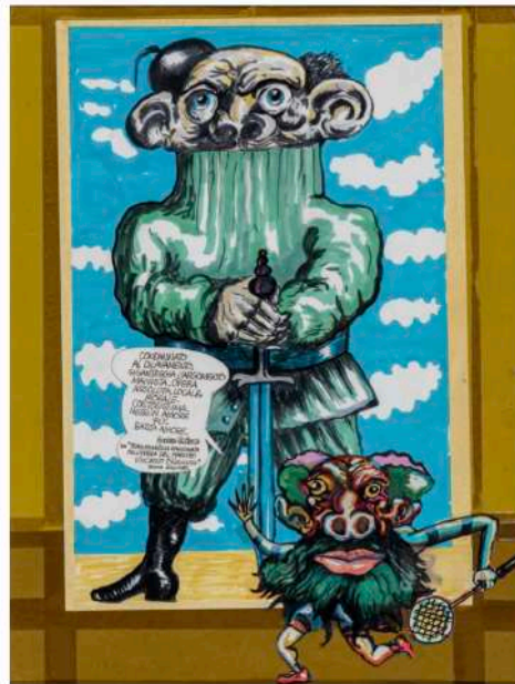
Andrea Paziienza, Vincenzo Sparagna, Basta Amore , 1985, pennarello e collage su carta applicato su cartone, 38x54 cm.

Da Andrea Paziienza a Stefano Tamburini , da Vincino a Fabio Visintin , tutti i disegnatori di spicco di quel momento d'oro dell'illustrazione italiana sono presenti nell'incanto di Art-Rite. A partire, appunto, dal top lot di quest'asta: il raro autoritratto di Andrea Paziienza , Paziembran , realizzato a pennarello su foglio trasparente e proposto in catalogo al lotto 87 con una stima di stima 13-18.000 euro.