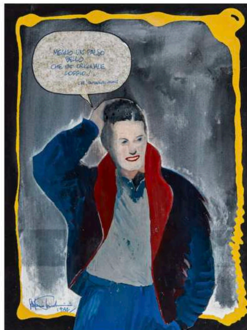
Stefano Tamburini, Meglio un falso bello , 1984, tecnica mista e collage su carta, 31.4x24 cm

Sempre di Paziienza , insieme al collega e direttore Vincenzo Sparagna , è anche Basta Amore (Lotto 117, stima 6-8.000 €), pennarello e collage su carta applicato su cartone del 1985 e parte del progetto sulla "Pittura maivista", movimento multiforme che in modo ironico ha voluto schierarsi contro la canonica distinzione tra "arte per il popolo" e "arte per le élites".