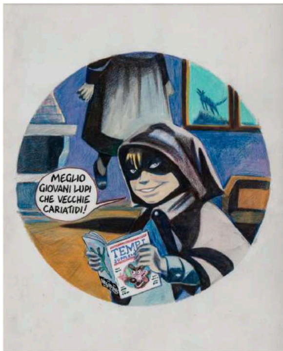
Fabio Visintin, Meglio giovani lupi che vecchie cariatidi, Collezione Tempi supplementari, 1986, tecnica mista su carta, 30x24,5 cm.

Tra i lotti di particolare pregio si segnala la copertina del primo volume di Collezione Tempi supplementari (Lotto 115, stima: 2- 3.000 €), rivista nata con l'idea di dare spazio ai nuovi talenti, firmata da Fabio Visintin nel 1986.