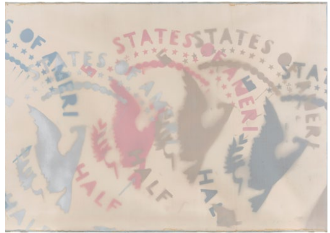
Franco Angeli (1935 - 1988), "State of America" (1967)

A destra / à droite : Renato Guttuso (1911 - 1987) "Tramonto sul Monte Rosa" (1968)